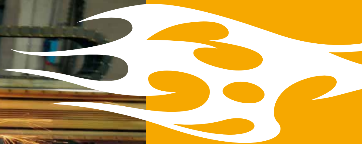
THE FLASH OF LIGHTNING carbon steel S235JR pickled cold rolled sheet thickness 12 mm weight: 750 kg